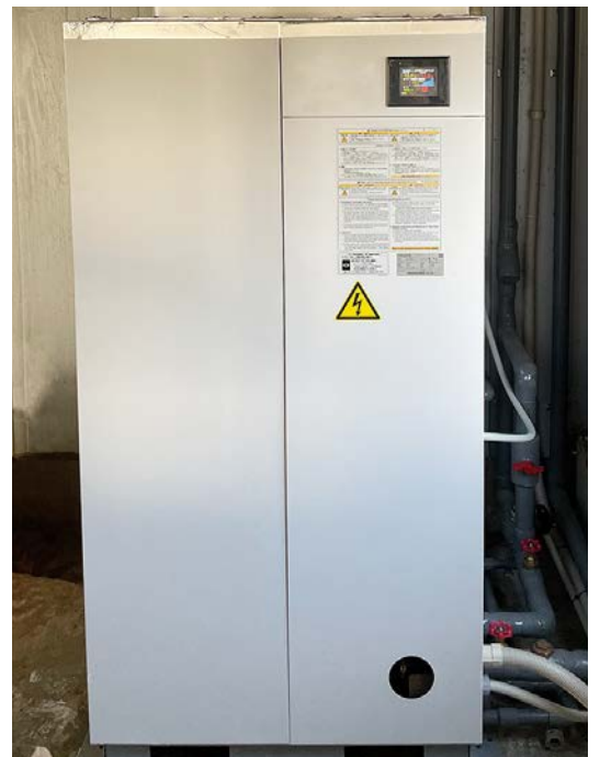
冷水を生成するチラー