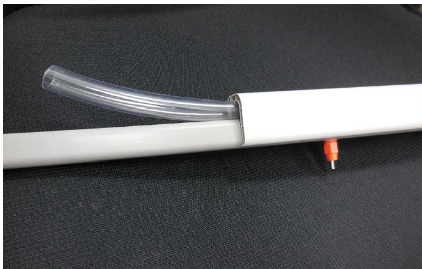
装着簡単な新型カバーと冷水チューブ