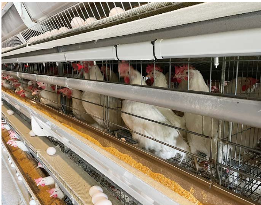
暑い夏も元気な鶏

38℃以上の猛暑が来ても、常に20数℃の飲み水を供給でき、飼料摂取量を改善して、産卵性及び個卵重を平常に保つことができます。