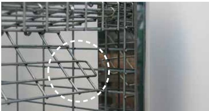
トビラは引っ掛け方式