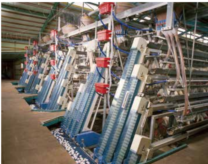
高床ヒナ段式集卵機 高床式、低床式ヒナ段ケージに絶大な実績を持つ集卵機です。