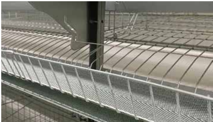
エッグガードまで見えるので洗浄が容易