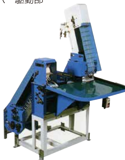
ヒナ段式ワンテーブル集卵機 作業性のよい高さにテーブルがあるため効率よく作業ができます。