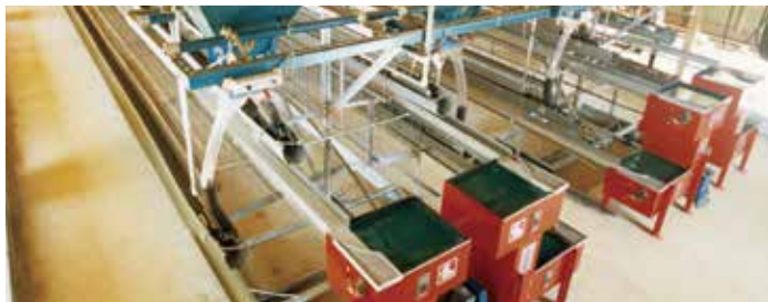
低床ヒナ段式各段テーブル集卵機