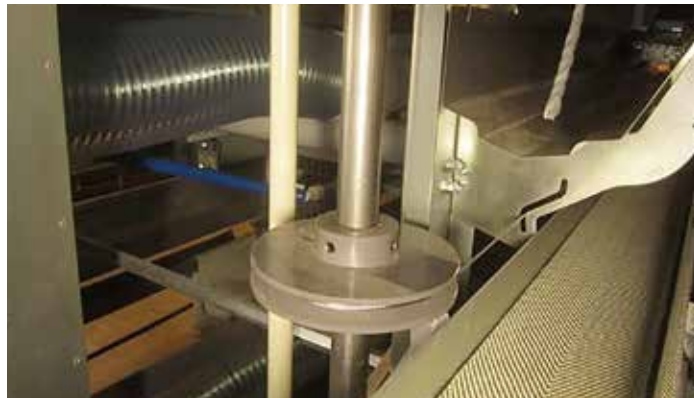
エッグセーバー駆動部