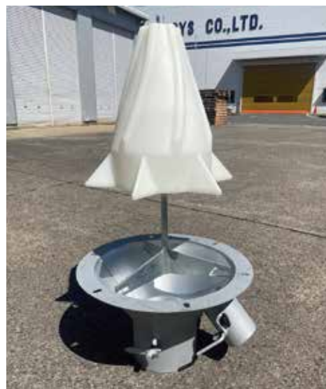
ブリッジ防止装置