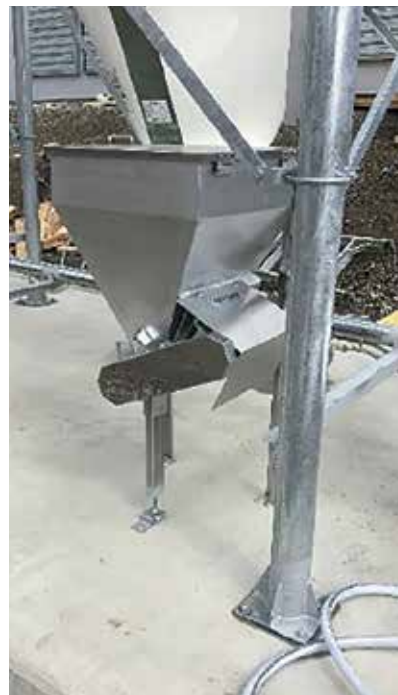
飼料添加物投入装置