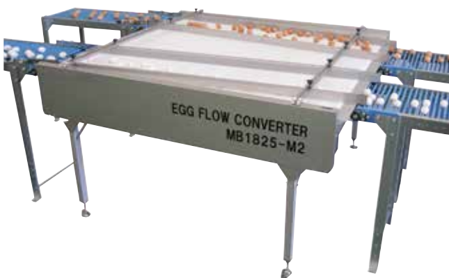
エッグフローコンバーター