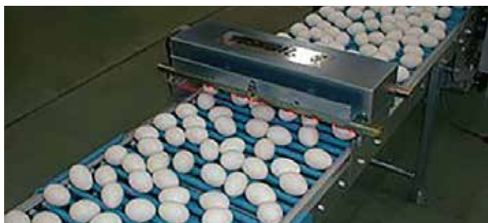
エッグカウンター