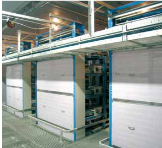
軟卵受けコンベア