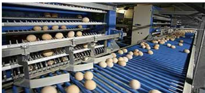
両側駆動式バーコンベア