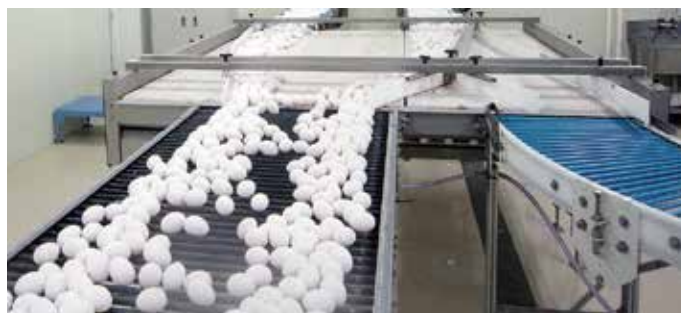
エッグフローコンバーターに対応