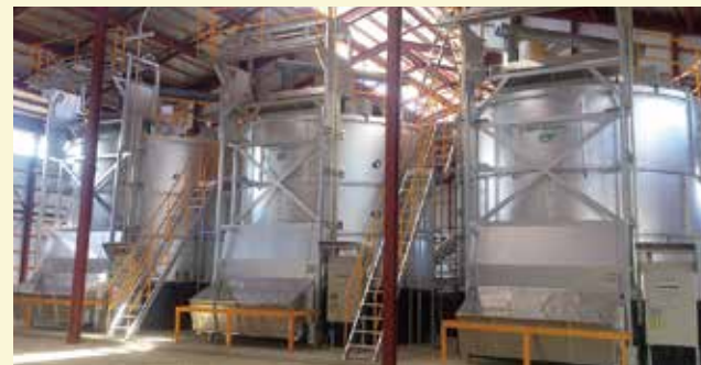
堆肥舎内部(コンボ)