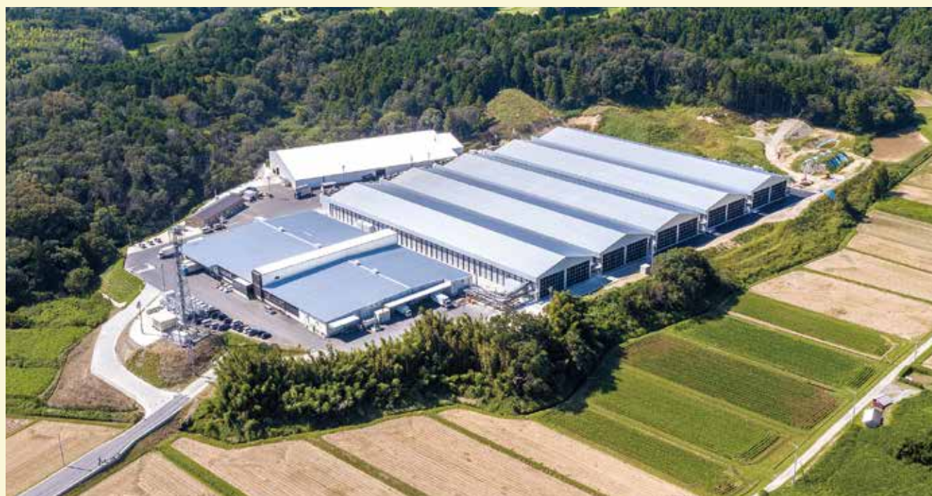
鶏舎に直結したインライン型GPセンター(三重県)