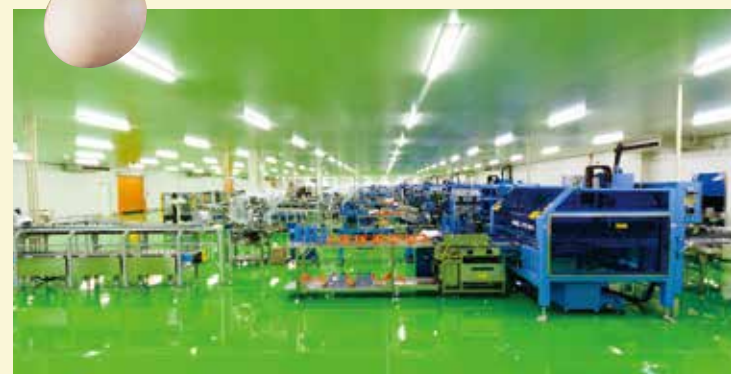
自動パッケージライン(毎時24万卵)