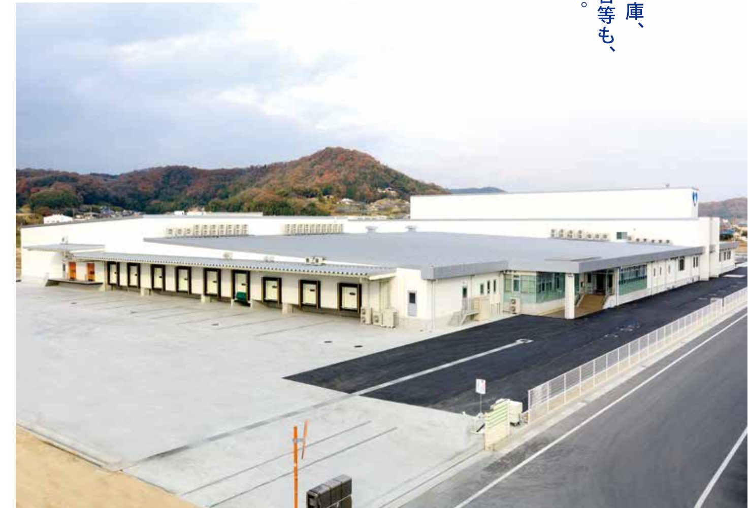
大規模GPセンター(敷地約6000坪、建築面積約3000坪)

ヨシダエルシスは、 鶏舎建築だけでなく、 鶏卵GPセンター・倉庫、 冷凍・冷蔵庫及び宿舎等も、 設計・建築しています。