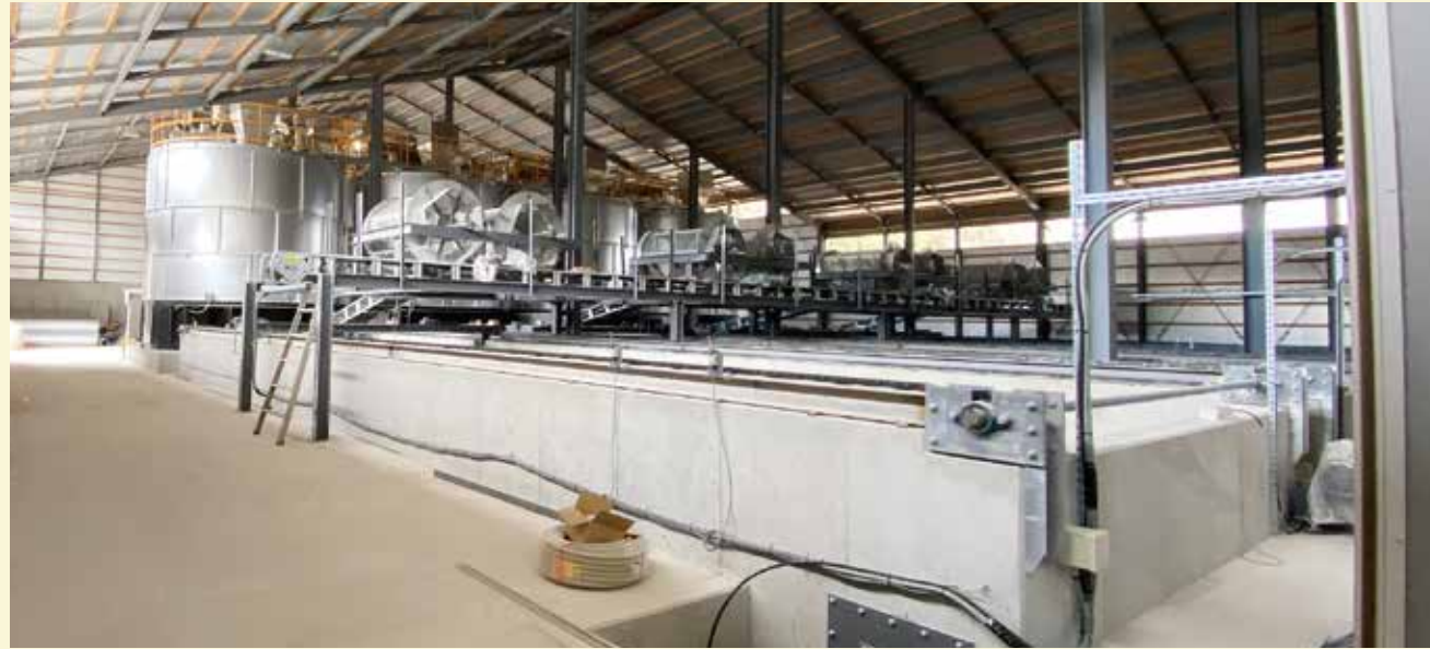
堆肥舎内部(堆肥冷却装置)