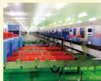
グレーディングルーム