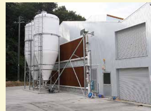
セミウインドレス鶏舎