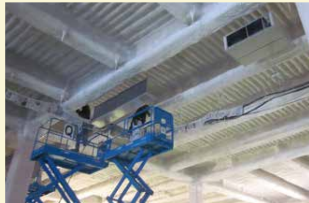
ウレタン吹付工事