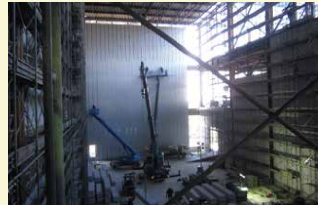
大型倉庫のパネル工事