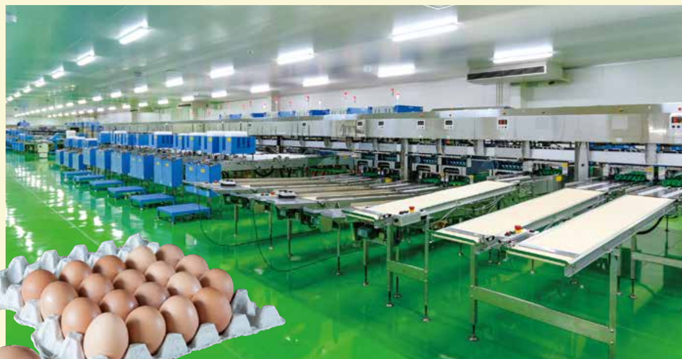
明るく清潔感あふれるセンター内部。ロスのないラインレイアウトで生産性も高まります。

原卵、半製品の自動倉庫等を備えたセンター内部は、理想的なラインと清潔感があります。