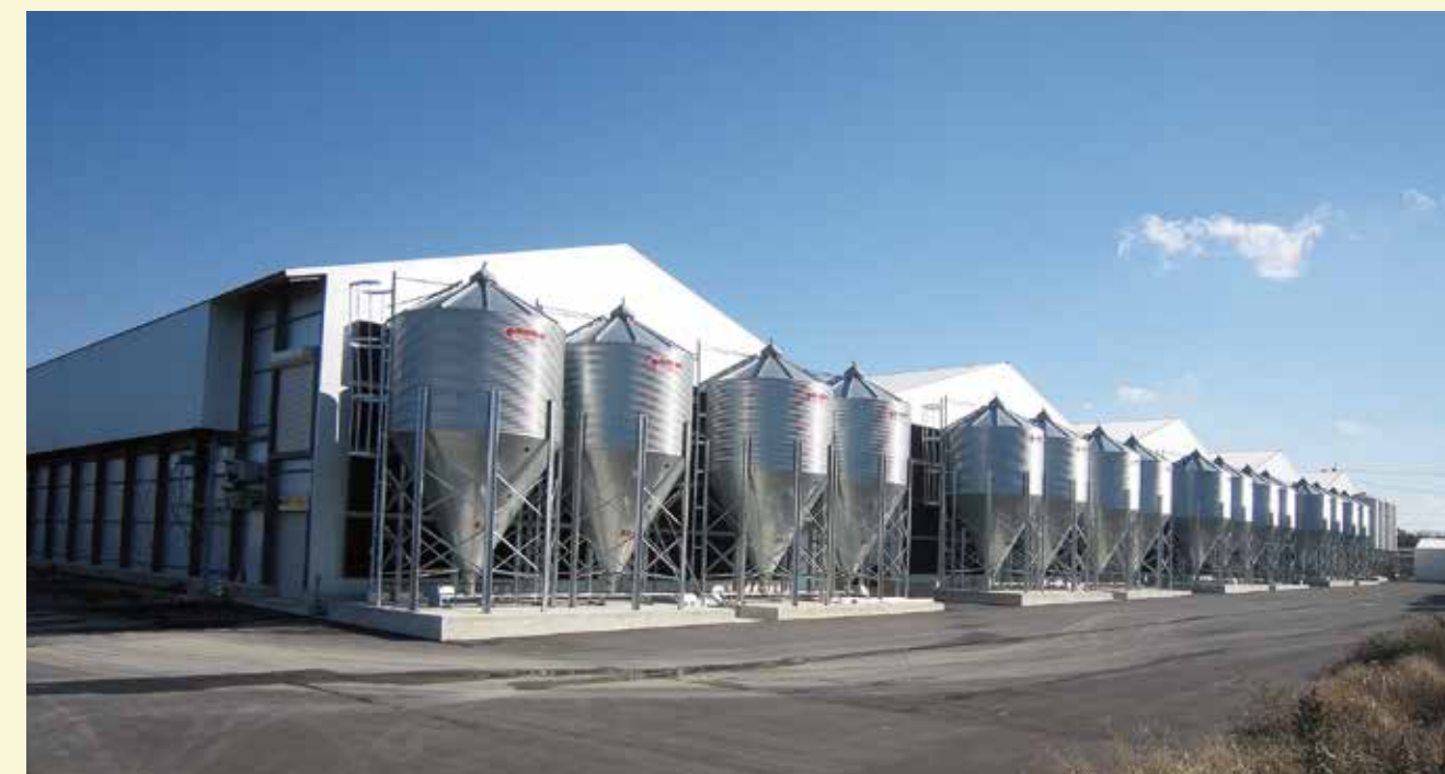
ウインドレス鶏舎