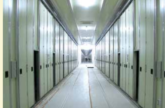
きのこ工場のドアパネル